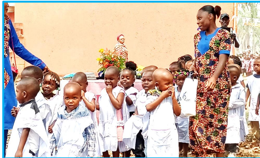
De kleintjes van onze Kleuterschool TEMUKA in Popokabaka

proberen wij deze corrupte gewoonten uit te roeien maar wij moeten eerlijk toegeven dat het nog niet lukt.