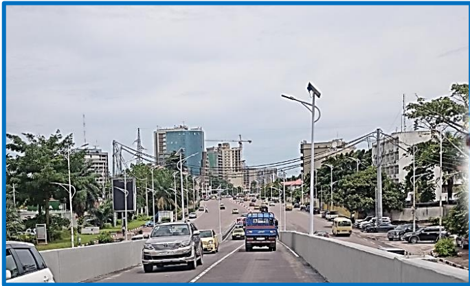
Kinshasa ... de hoofdstad met méér

Telkens verlang ik naar die rustgevende brousetochten. Tijdens het eerste stuk van de trip bollen wij op een tamelijk stevige betonweg. Na een 30-tal kilometers merken wij duidelijk het uitvloeien van de hoofdstad Kinshasa in kleinere agglomeraties die getuigen van de niet te stoppen uitbreiding van Kin met zijn méér dan 12 miljoen inwoners. De huisvesting en de oppervlakte van de parceleertjes in die buitenwijken vertellen dat er hier een veel armere bevolking samenkomt.