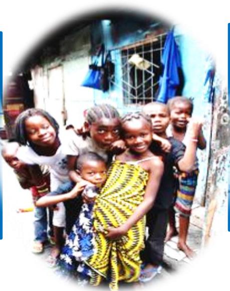
dan 12 miljoen inwoners