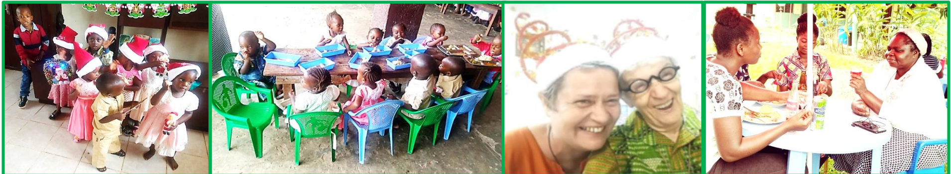
Het kerstfeest in het weeshuis van Malole/Kananga

Wij hadden redenen om DANKBAAR te VIEREN !